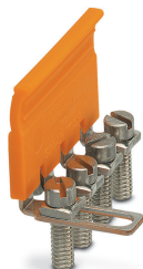
Switching jumper, pitch: 8.2 mm, number of positions: 4, color: silver

このPDF文書に表示されているデータはフェニックス・コンタクトのオンラインカタログから作成したものです。全データはユーザーマニュアルに記載されています。ダウンロードの規定は有効です ( http://phoenixcontact.jp/download )